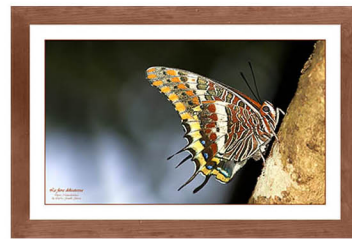
La fiera delicatezza

i cinque di cui sopra più un diffusore acustico per l’udito, un’essenza per l’olfatto, rametti per il tatto, una caramella-dolcetto per il gusto ed infine l’istantanea per la vista. Nell’insieme sono così coinvolti e stimolati contemporaneamente i cinque sensi, in vere e proprie opere uniche.