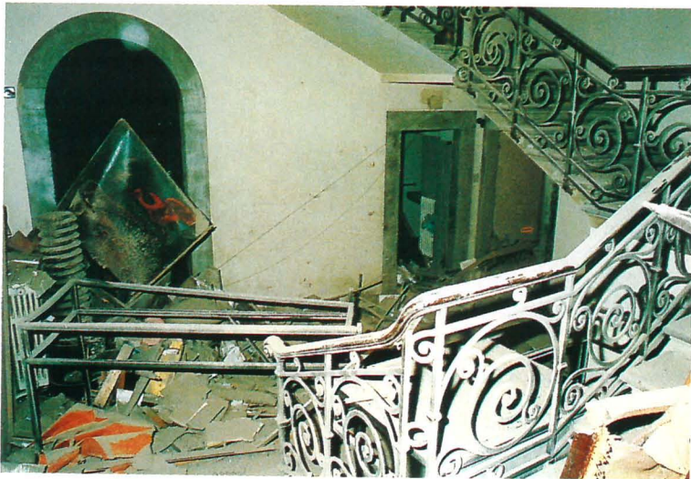
FIG. 7 e 7a. – Il vano delle scale principali della Sede Accademica. (Figura 7a: Foto Torrini )