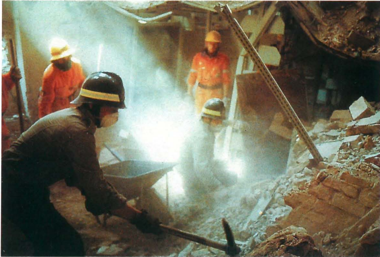
FIG. 6 e 6a. — La Biblioteca.