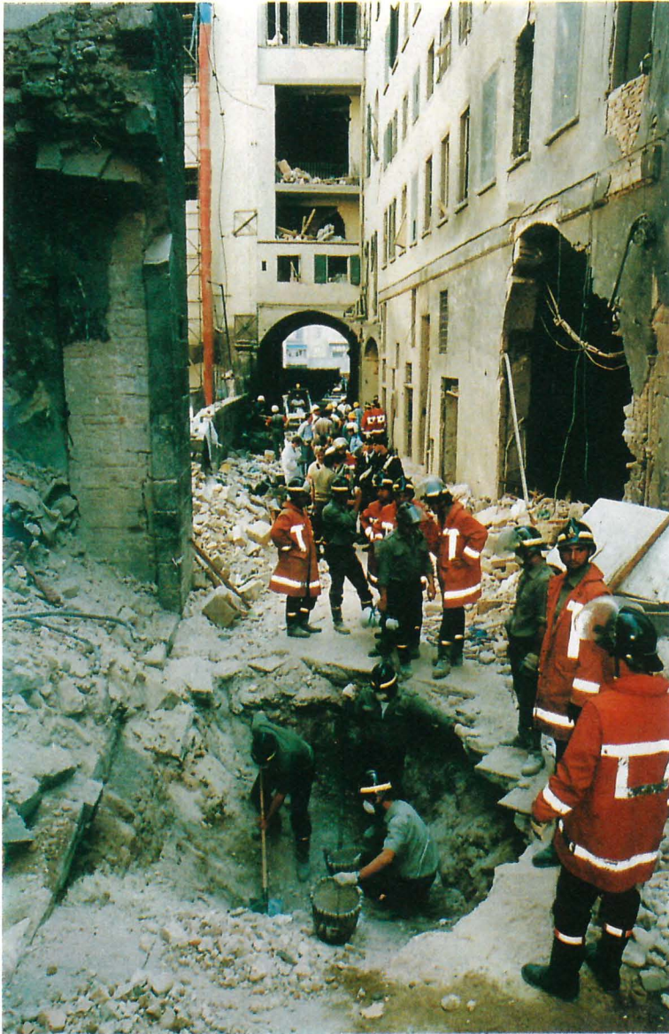
FIG. 3. — Il cratere provocato dall'autobomba posta davanti all'ingresso secondario dell'Accademia in Via dei Georgofili.