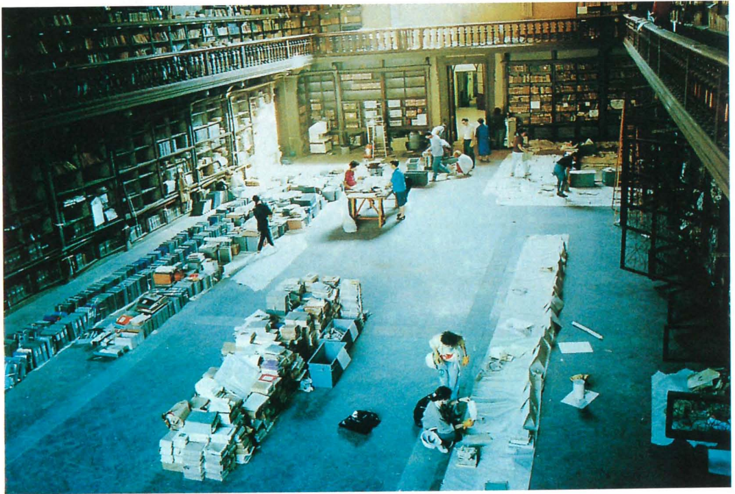
FIG. 11. — Il Salone Magliabechiano durante il lavoro di raccolta del materiale recuperato.