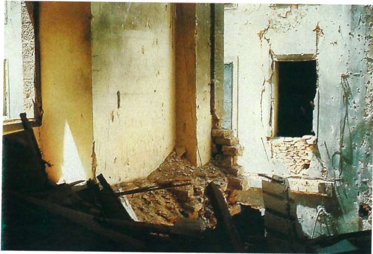
FIG. 8 e 8a. — La Sala del Consiglio.