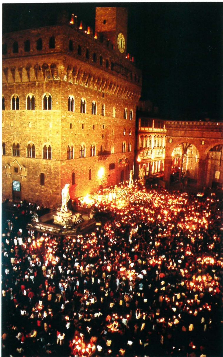
FIG. 12. – Piazza della Signoria la sera del 2 giugno 1993.

“I fiorentini si raccolsero intorno al Gonfalone, in piazza Signoria, a testa alta verso la Martinella. Avevano acceso 30mila fiaccole per dimostrare che un boato di morte può anche generare la vita. E non ci furono discorsi, perché tutti avevano un sacrosanto terrore della retorica. Ci fu solo, per cinque minuti, il suono della campana del Carroccio, posta in cima alla torre di Palazzo Vecchio. Seguì il silenzio, così profondo da non sembrare vero. E poi ci fu l’applauso, liberatorio, che invase le strade del Centro finché il campanone del Duomo sovrastò ogni rumore”.