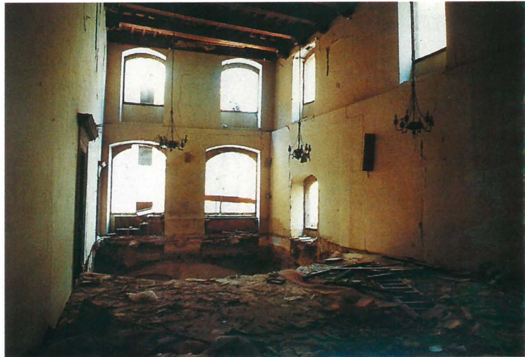
FIG. 9 e 9a. — La Sala delle Adunanze. (Figura 9a: Foto Bartolozzi)