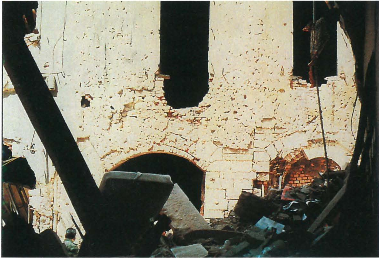
FIG. 5 e 5a. — La sala di lettura dell'Accademia prima e dopo l'esplosione.