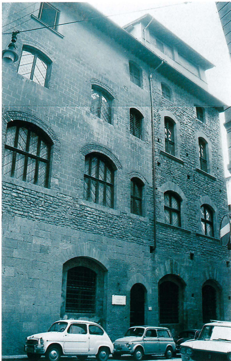
FIG. 4. — La Torre de' Pulci. La foto è del 1964.