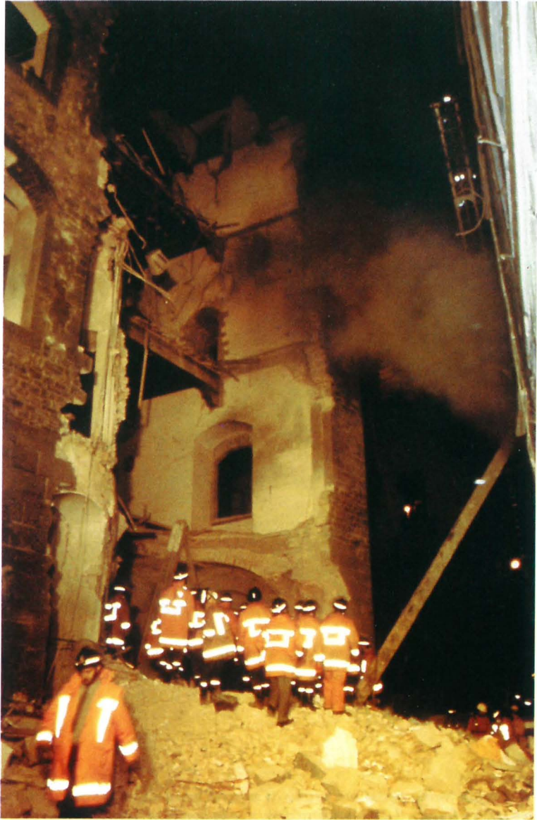
FIG. 2. — Via dei Georgofili, ore 1.30 del 27 maggio 1993. I Vigili del Fuoco lavorano sul cumulo di macerie che, in corrispondenza della Torre de' Pulci, hanno raggiunto quasi l'altezza del primo piano.